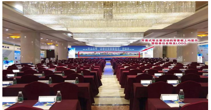
大会背景墙显示单位名称及 logo