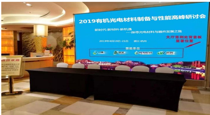
大会签到处背景墙显示单位名称及 logo