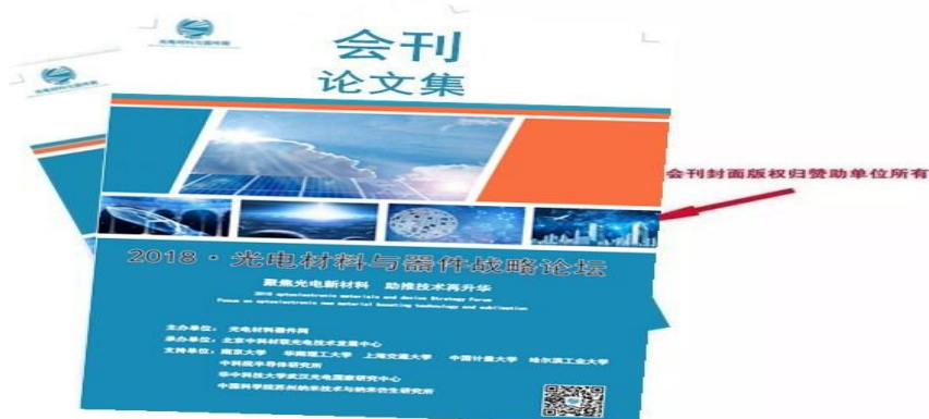
论文集及会刊广告（封面、封底）